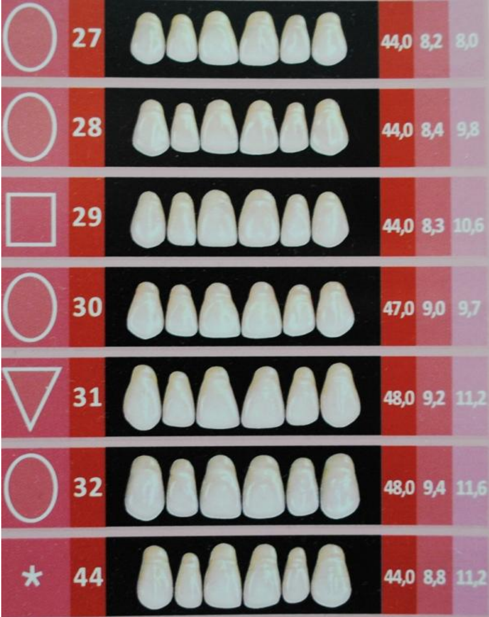
Зубы Эстедент-02 СТОМА